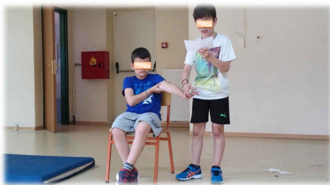
Εικόνα 6: Στις πρόβες 2