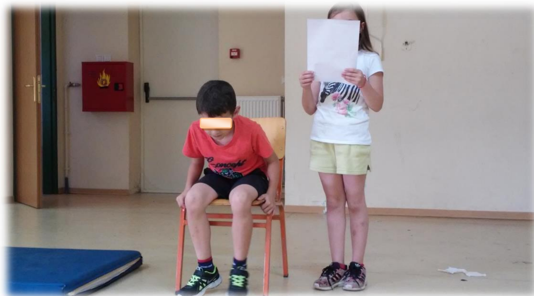
Εικόνα 5: Στις πρόβες 1