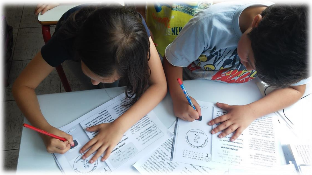
Εικόνα 1: Ετοιμάζοντας τα ενημερωτικά φυλλάδια

Πολλοί ήταν αυτοί που ενδιαφέρθηκαν να μάθουν πώς να παρέχουν πρώτες βοήθειες σε συγκεκριμένες καταστάσεις: παρίσταναν, λοιπόν, το θύμα και οι μικροί διασώστες -που είχαν φροντίσει να διαθέτουν όλο τον απαραίτητο εξοπλισμό- έδειχναν βήμα-βήμα εξηγώντας παράλληλα τον σωστό τρόπο αντιμετώπισης κάθε περιστατικού και δίνοντας συμβουλές για γρήγορη και αποτελεσματική ανάρρωση.