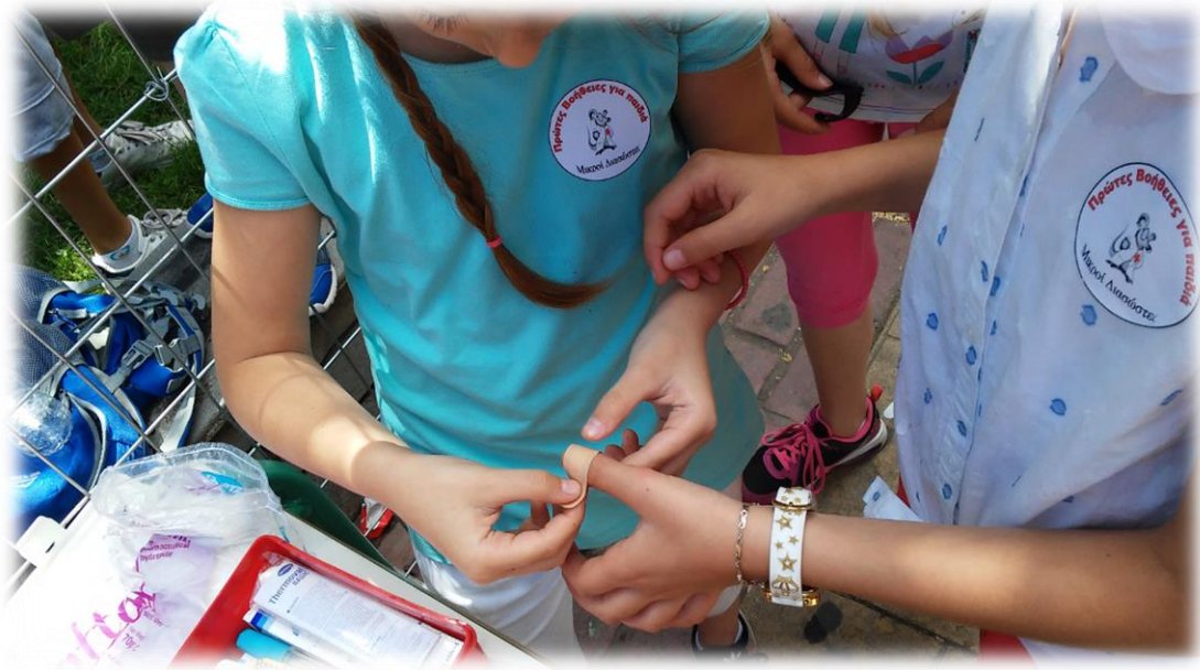
Εικόνα 19: Αντιμετωπίζοντας μικροκοψίματα