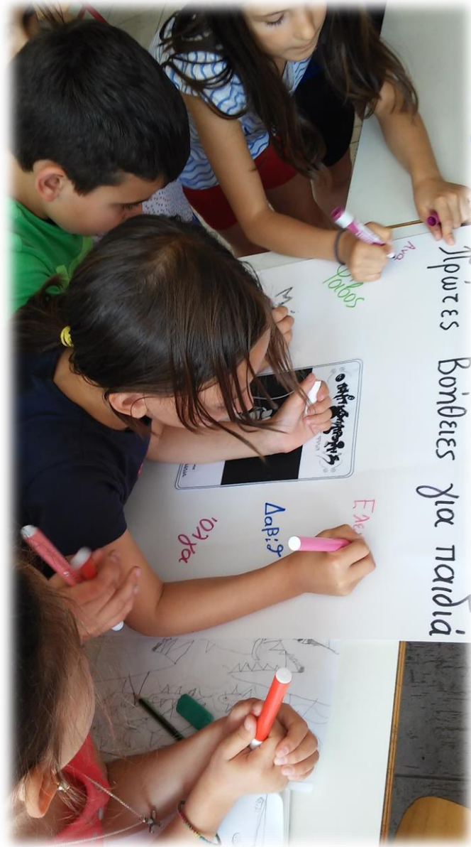
Εικόνα 2: Φτιάχνοντας τις αφίσες 1