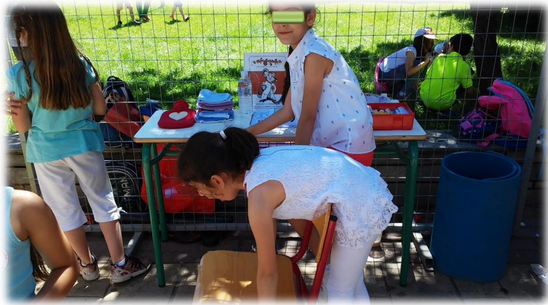
Εικόνα 17: Στραβοκαταπίνοντας...