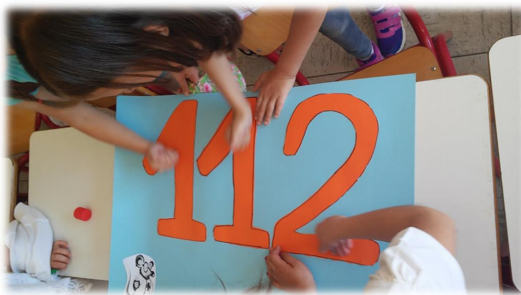
Εικόνα 4: Φτιάχνοντας τις αφίσες 3