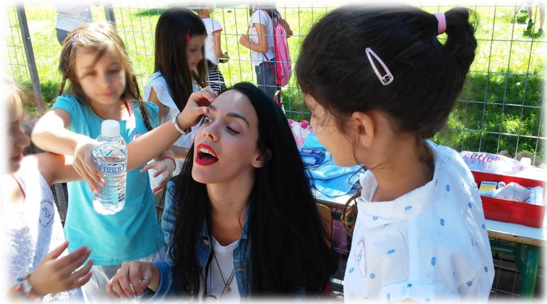
Εικόνα 11: Ωχ, κάτι μπήκε στο μάτι μου!