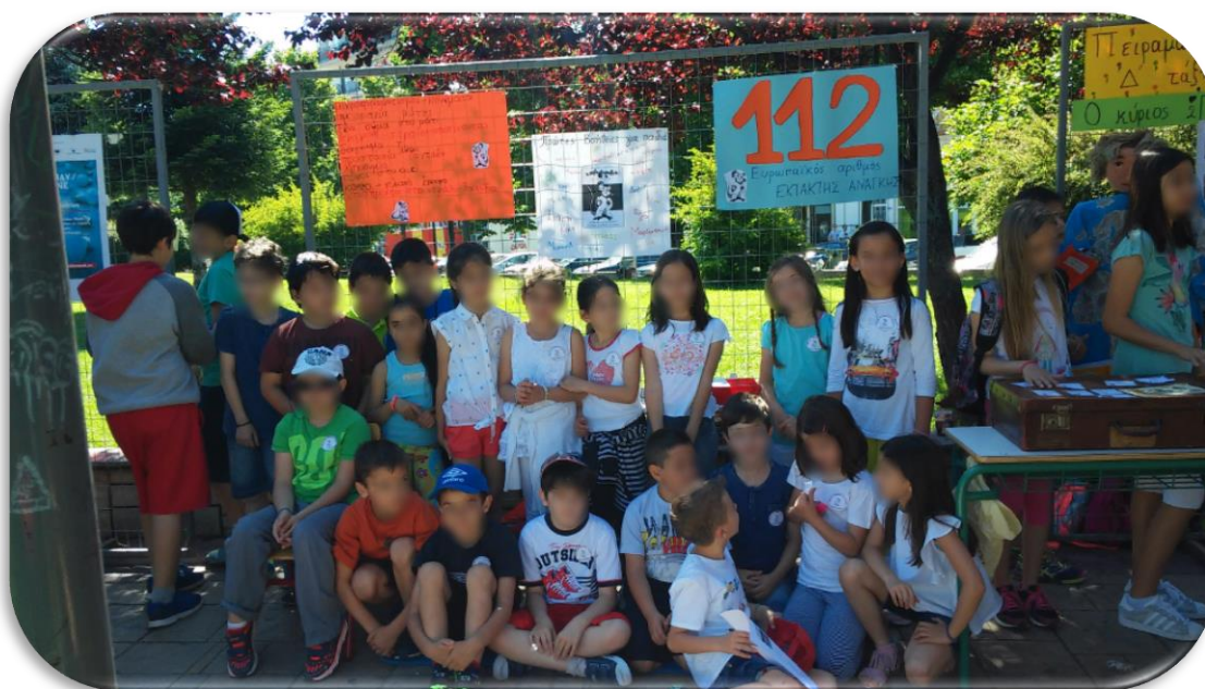
Εικόνα 1: Οι Μικροί Διασώστες σε απαρτία