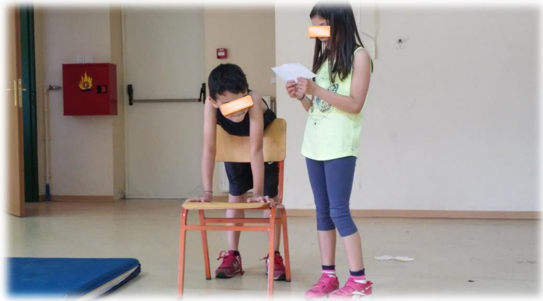
Εικόνα 7: Στις πρόβες 3