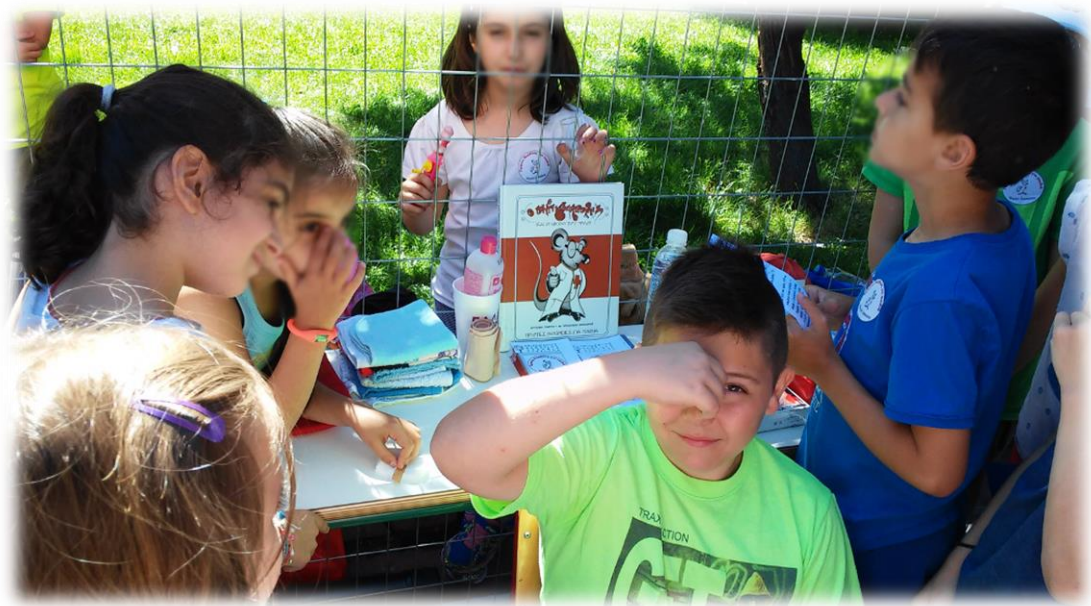
Εικόνα 12: Συμβουλές για ρινορραγία