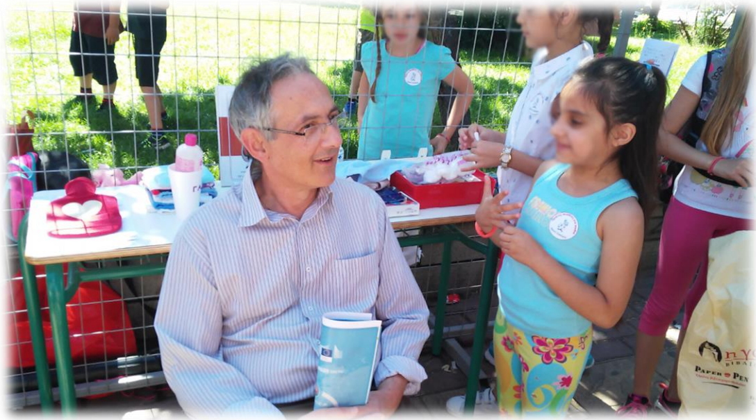
Εικόνα 13: Παρέχοντας πρώτες βοήθειες στον Διευθυντή Πρωτοβάθμιας Εκπαίδευσης