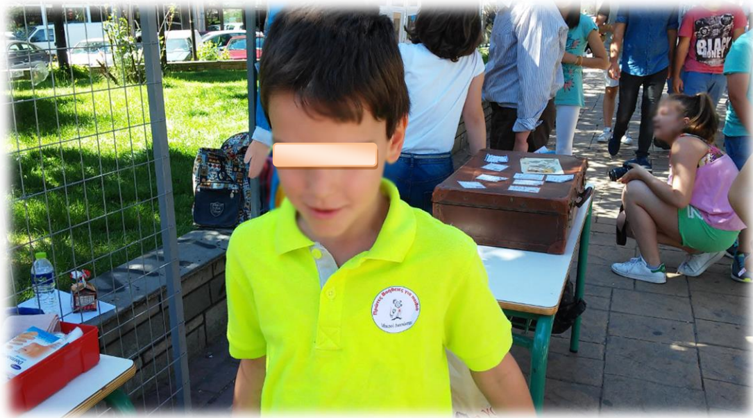
Εικόνα 9: Μικρός Διασώστης έτοιμος να επέμβει!