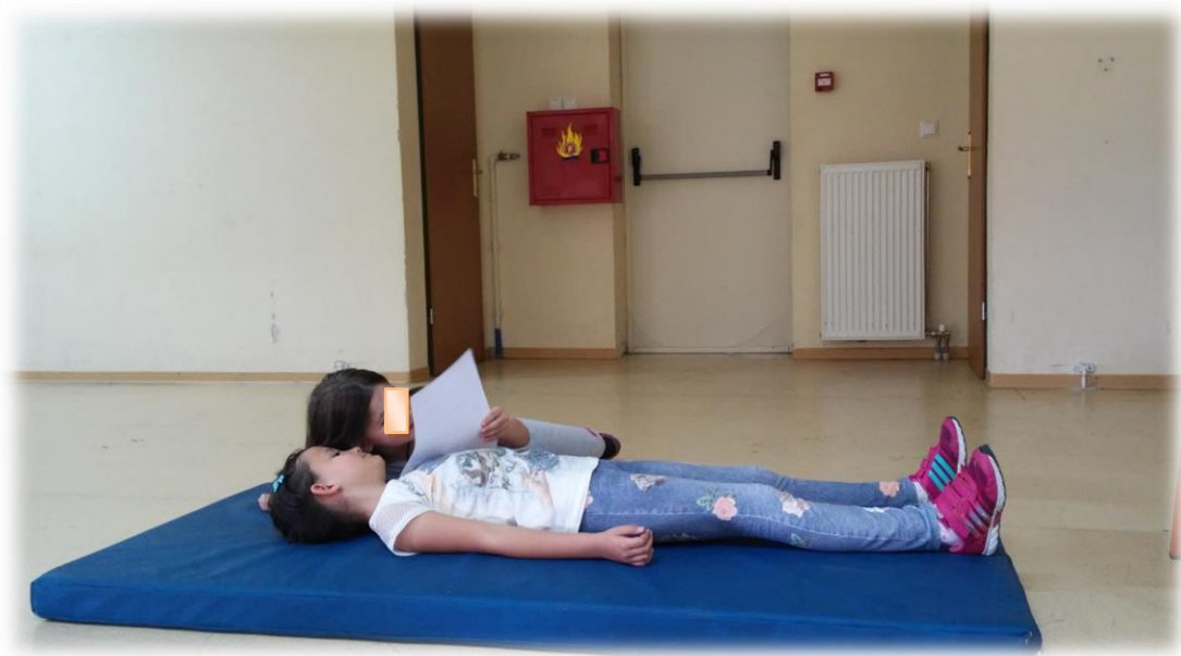
Εικόνα 8: Στις πρόβες 4