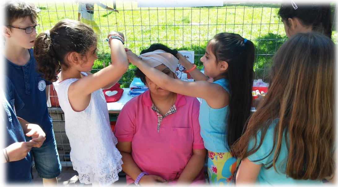
Εικόνα 15: Τραυματισμός στο κεφάλι