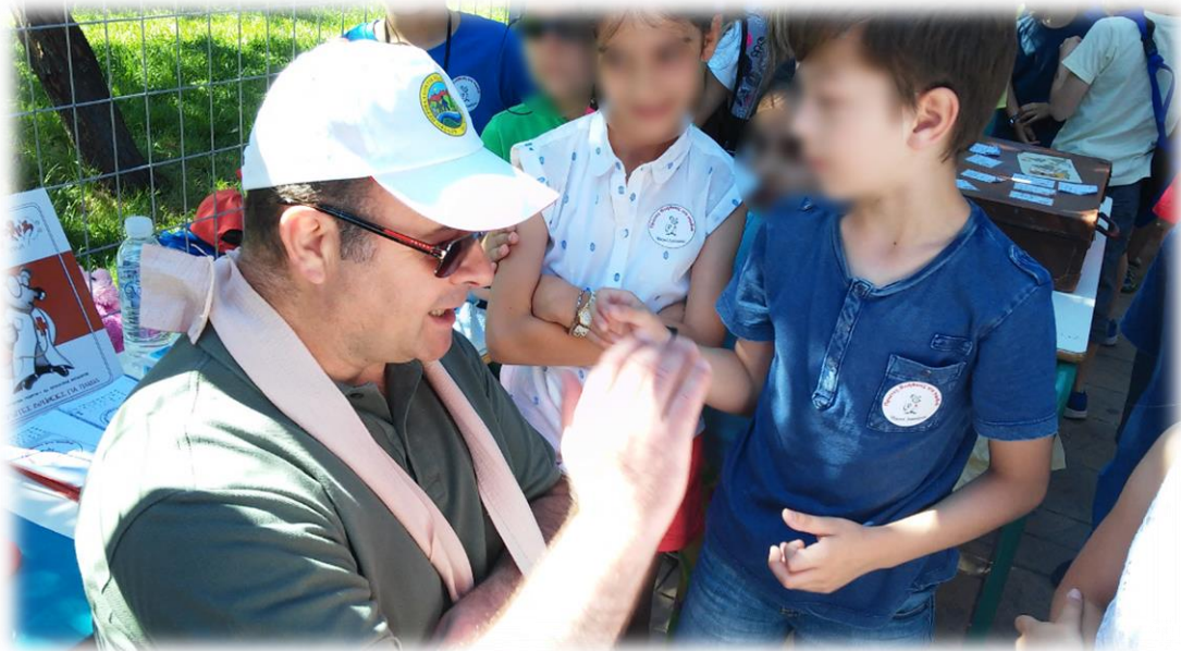
Εικόνα 10: Δίνοντας πρώτες βοήθειες στον σχολικό μας σύμβουλο