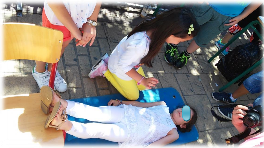
Εικόνα 18: Λιποθυμικό επεισόδιο