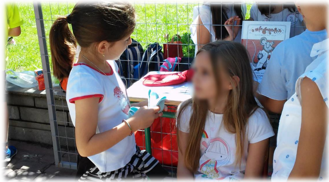
Εικόνα 20: Συμβουλές για εγκαύματα