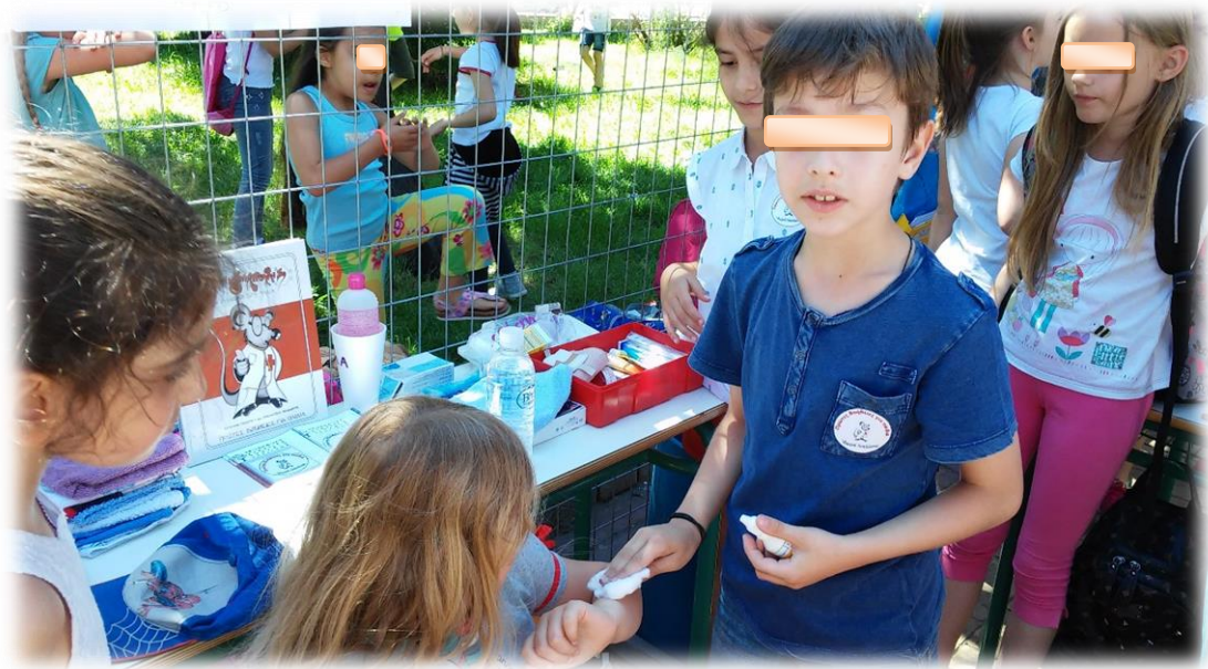
Εικόνα 16: Αντιμετώπιση μικροτραυματισμών